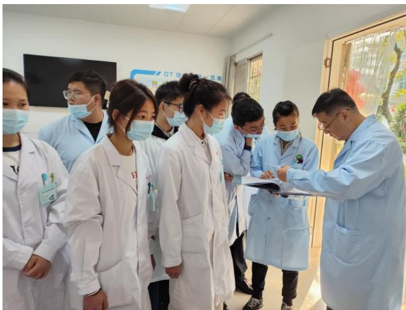
图 8 企业实践教学基地教学活动