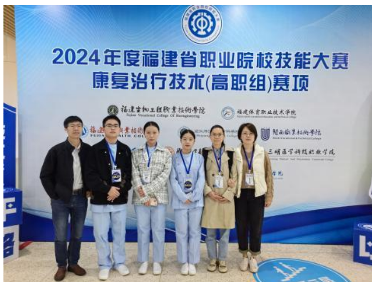
图4 指导学生参加福建省职业院校技能大赛

2017年学校与龙岩慈爱康复医院合作办学，成功获得福建省教育厅现代学徒制的试点立项，基本形成“政府、企业、学校”三元合一的学生实习管理体系，探索创建“学生→学徒→准员工→员工”四位一体的特色人才培养模式，全面提高学生实习专业对口率，切实提高学生岗位技能。参与指导学生参加2024年福建省职业院校技能大赛高职组“康复治疗技术”赛项，获团体一等奖。