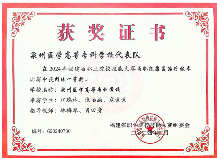
图5 福建省职业院校技能大赛高职组“康复治疗技术”团体一等奖获奖证书