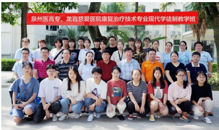
图 2 校企合作康复治疗技术专业现代学徒制教学班

从 2009 年开始，作为学校的校外实训基地，每年承担 10 名左右康复治疗技术专业学生为期一年的毕业实习教学工作，从 2017 年开始又与学校合作共同承办康复治疗技术专业现代学徒制班第二学年和第三学年的教学任务，积累了丰富的教学经验。目前，校企合作办学已有 5 届现代学徒制学生。