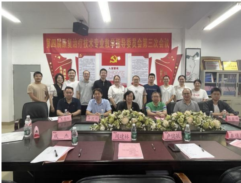
图6 共同制定各专业人才培养方案

龙岩慈爱康复医院作为学校康复治疗技术专业建设指导委员会副主任委员单位，共同参与制定各专业人才培养方案，确定专业课程及实验项目，编写相应教学大纲、实验实训大纲等。