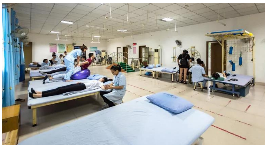
图 3 企业内部设施

慈爱康复医院拥有先进医疗设备 1.5T 核磁共振、16 排螺旋 CT、大型全身及血管彩超仪、神经肌电图及诱发电位、眼震图、动态脑电图、大型生化仪、电化学发光仪等高端诊断设备投入 1200 万元，配备步态训练与评估系统(下肢机器人)、上肢评估与训练系统、YRD CCY 型磁场刺激仪、经颅直流电刺激仪、数字化上肢多功能系列训练系统、运动控制学习和悬吊训练系统、体外反搏系统、体外冲击波治疗系统、数字化上肢多功能系列训练系统等成人康复、老年康复全套系统设备投入 1300 万元；配备动眼仪、智能交互式平板、体外冲击波治疗系统、红外偏振光、重复经颅磁、疗愈宝、智能多感官、天网系统、引导式生物反馈、天轨系统、注意力脑机接口训练系统、摆动步态训练仪、超声波水疗设备、儿童上下肢智能康复训练系统、儿童注意力测试分析仪、上下肢主被动运动康复机（儿童情景互动康复训练系统）等儿童康复全套系统设备投入 500 万元。