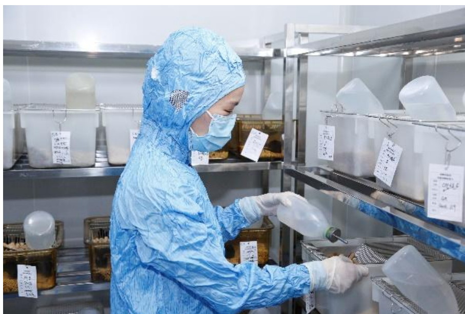
图 3-3 泉州市动物实验中心人员进行动物饲养