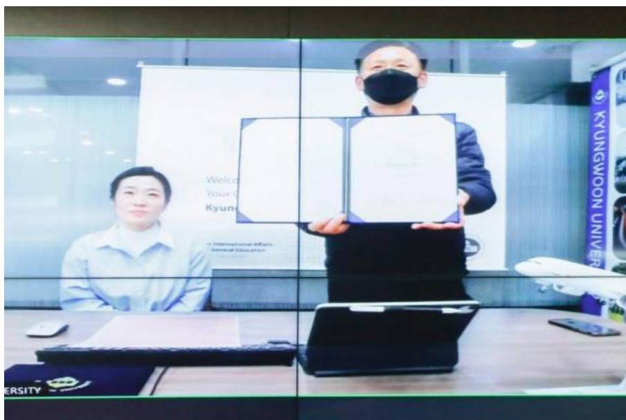
图 5-1 学校和韩国庆云大学举行线上合作交流暨签约仪式(韩国)

2024 年,学校深化国际合作,促进教育交流,1 月与韩国庆云大学成功举办线上合作交流会并签约(见图 5-1 和图 5-2)。会后,双方通过密集座谈与高层互访,深化了学术交流与师生互访合作(见图 5-3 和图 5-4)。9 月,学校学生已成功赴庆云大学学习,标志着两校教育交流取得实质性进展,招生宣传工作成效显著。