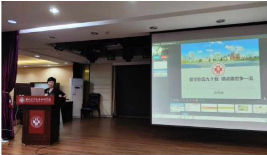
图 4-9 “春华秋实九十载 精诚惠世争一流”校史校情专题讲座