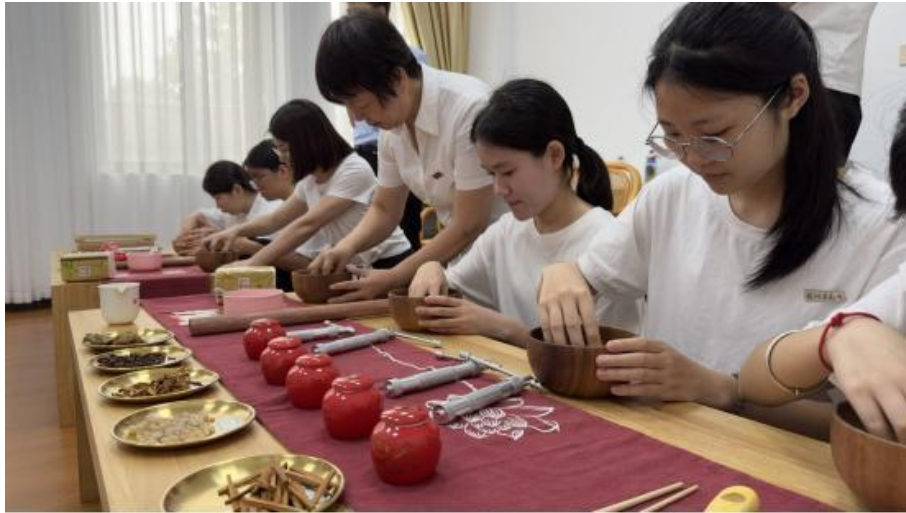
图 4-4 中医药传承活动

与泉州市洛江区实验小学等 5 所学校联合开展中药文化进校园的研学活动；与泉州市鲤城区卫生健康局、泉州市正骨医院、泉州市中医院等单位联合主办首届中医药文化集市活动。