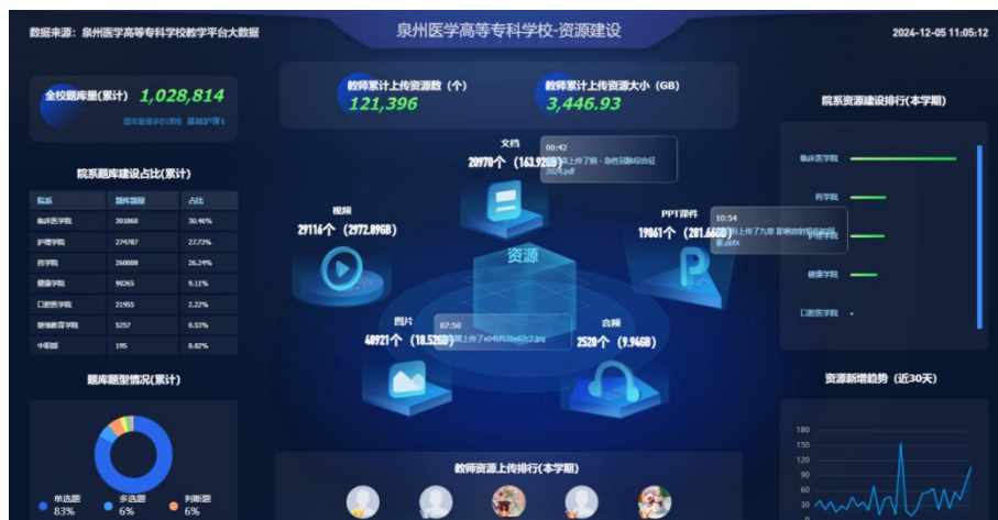
图 2-8 学校教学平台大数据