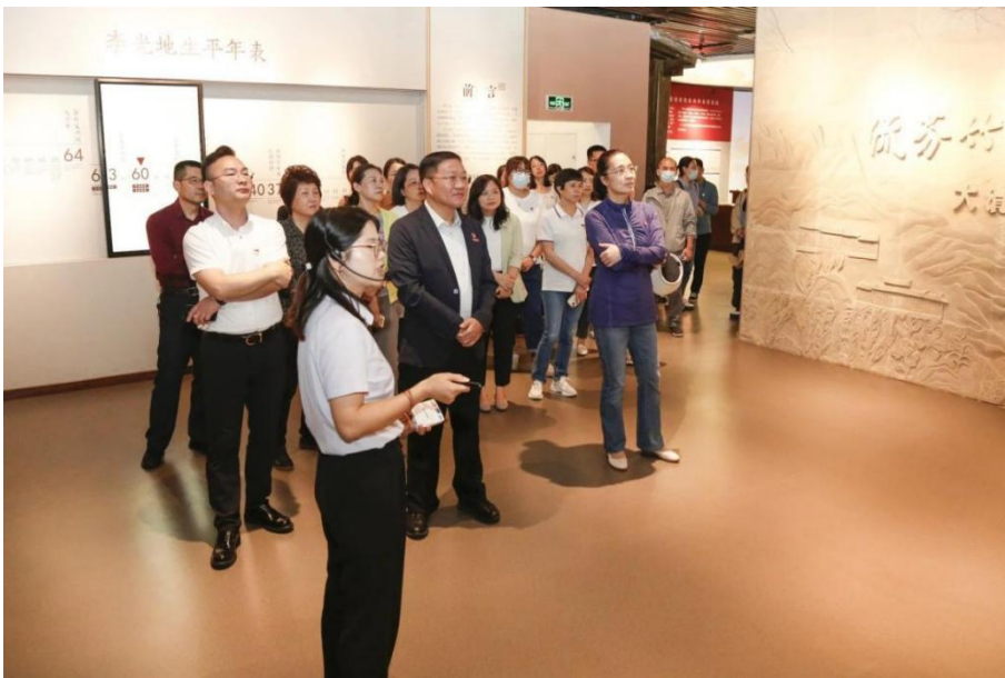
图 7-5 学校组织干部开展警示教育现场教学活动