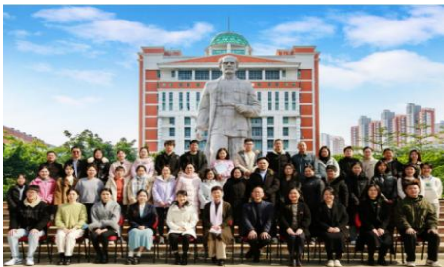
高级体液细胞形态学培训-名师讲堂全国小班化培训班（泉州）2024.1

学校充分发挥专业优势和社会服务职能，依托各培训平台（基地），开展形式多样、符合地方产业发展需求的培训。面向福建省各级医院的行业骨干开展高级体液细胞形态学培训（见图 3-1）；举办市级医学继续教育项目，面向泉州市各级医院的临床护理人员开展专业技术人员继续教育；面向超声医师从业人员开展职业培训等。本学年，学校累计开展各类行企培训 5037 人次，面向社会开展情绪疏导、保健推拿（见图 3-2）、膳食营养搭配等职业技能培训 1203 人次，服务范围广泛覆盖各类医药卫生行业从业人员等人群，有效提升行业人员从业能力和技能水平，为企业人力资源开发和就业创业服务。