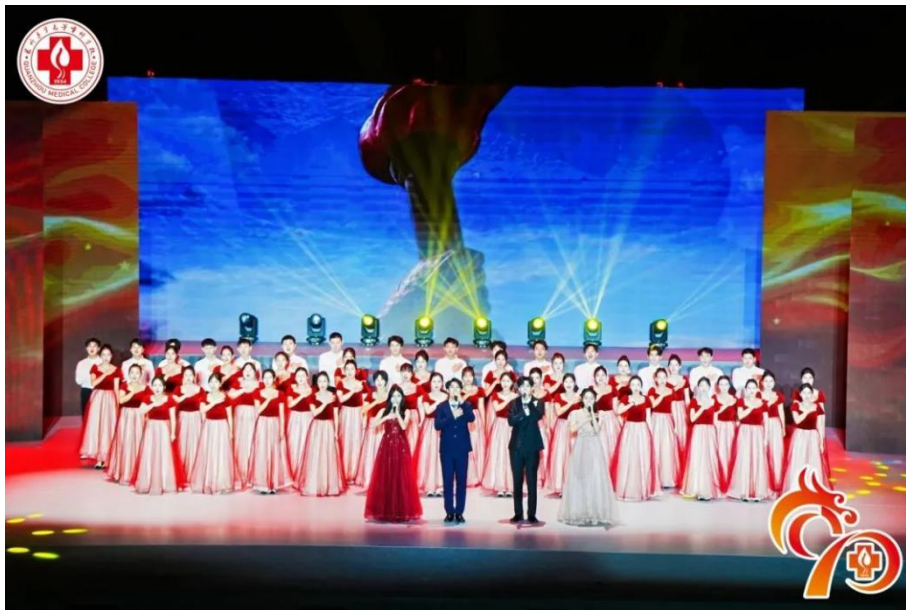
图 2-5 “精诚九秩育桃李 惠世华章谱新篇” 文艺汇演