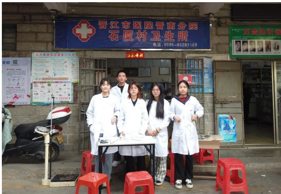
图 3-6 健康管理专业师生接受委托深入晋江市龙湖镇辖区开展健康服务

公共卫生学院健康管理专业师生受泉州中康健康管理服务有限公司委托，参与基本公共卫生数据调查，实践产教融合。43 名学生深入晋江市 23 个行政村，为居民测量血压、血糖，提供健康咨询，采集数据并整理健康档案，旨在提升居民健康素养，共筑健康中国梦（见图 3-6）。