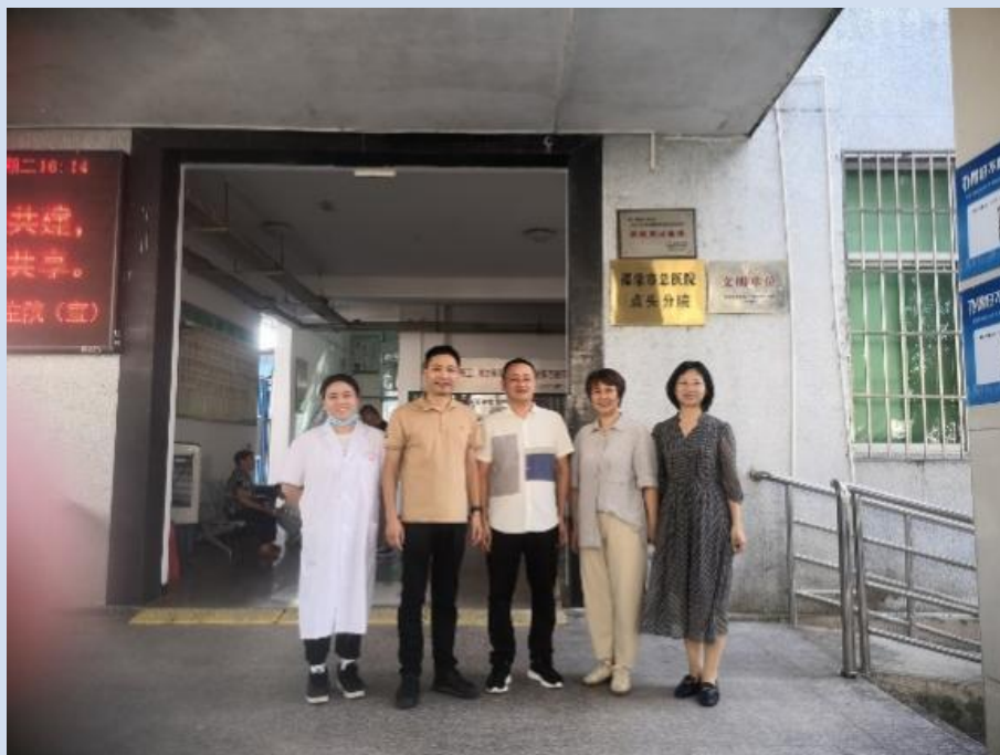
图 3-19 课题组开展调研工作

通过深入调研，课题组提出福建省高职医学院校人才培养和就业指导工作的建议，提出优化我省基层医疗单位人才选用和留用的政策建议，促进我省基层卫生医疗事业发展。