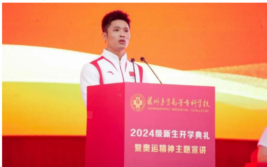
图 2-2 奥运冠军李发彬在开学典礼上作奥运精神主题宣讲

书记在福建考察时的重要讲话精神主题文化科技卫生“三下乡”（泉州医高专专场）活动（见图 2-3），通过主题微宣讲、互动问答、歌舞和非遗表演、体验，加深师生对习近平总书记在福建考察时的重要讲话精神的认识，增强对闽南传统文化、校园文化的认同感，让师生同上一堂兼具思想高度、情感温度、艺术厚度的美育“大思政课”。统筹和发动各院部在市社会科学普及宣传周期间积极开展相关活动，展示学校专业特色，努力培养德技并修、高素质技能型医药卫生人才。