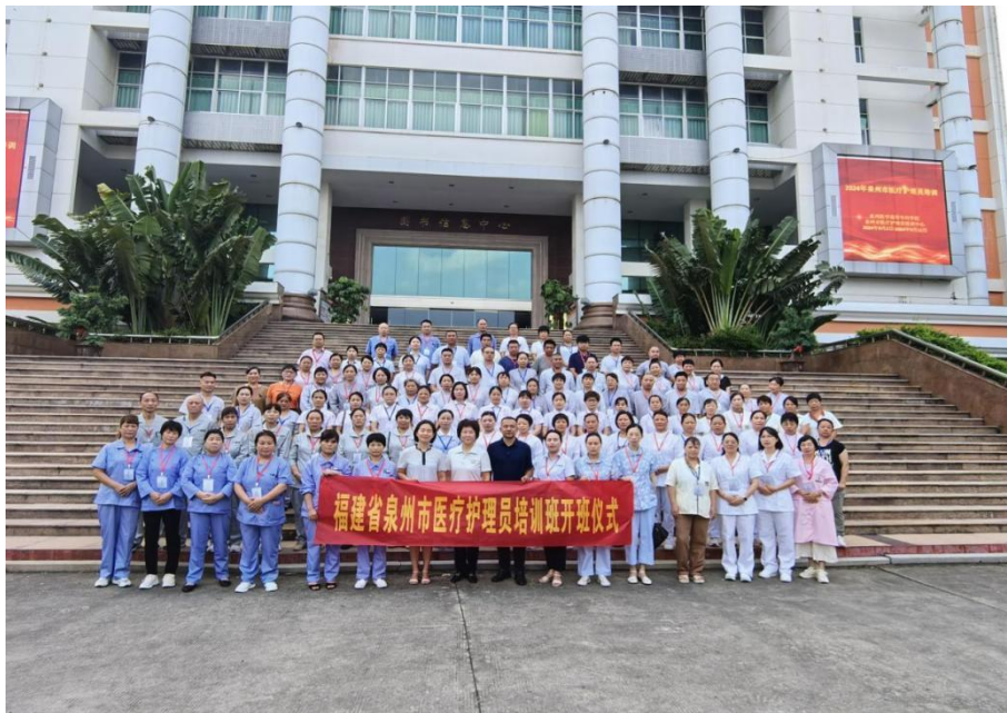
图 3-8 2024 年福建省医疗护理员培训班合影