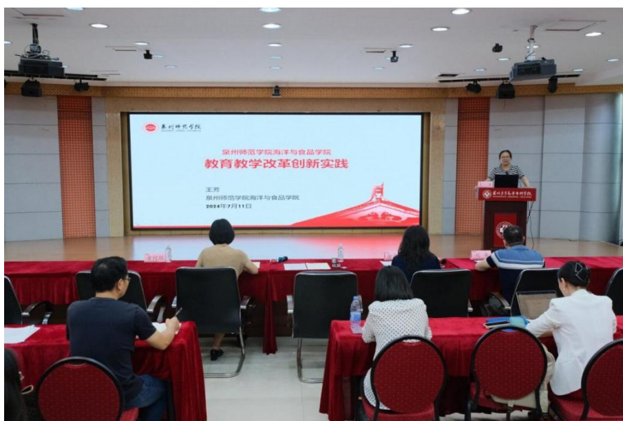
图 2-10 教育教学改革创新实践讲座