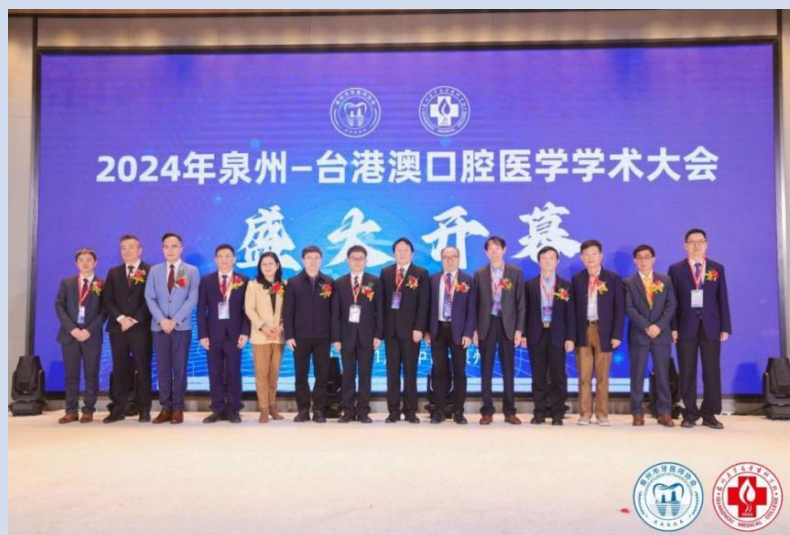
图 3-22 学校与泉州市牙医师协会联合主办“泉州-台港澳口腔医学学术大会”

大会期间,全国首个四地合作共建的口腔科技人才集聚平台——“泉州-台港澳口腔医学交流中心”在泉州正式成立。同时,中国牙病防治基金会“2024健康口腔万里行”走进福建泉州,并首次开设健康口腔推广大使培训班。此外,大会还促成了多项合作意向,包括北京口腔医学专家与学校附属医院的孤独症儿童牙科工作合作,以及学校与马来西亚拉曼大学的办学交流等,有力推动了口腔医学事业的融合发展。