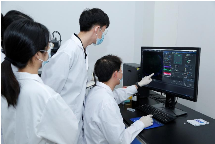
图 3-5 泉州市医学科研中心技术人员使用激光共聚焦显微镜