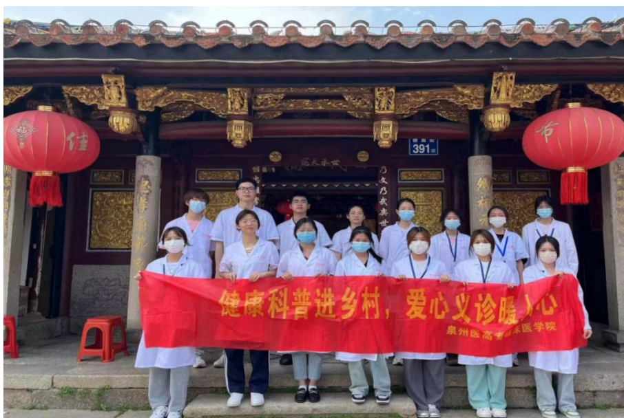
图 3-15 前往桥南社区开展健康科普宣教