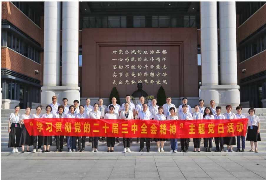
图 7-4 学校赴东山开展“学习贯彻党的二十届三中全会精神”主题党日活动