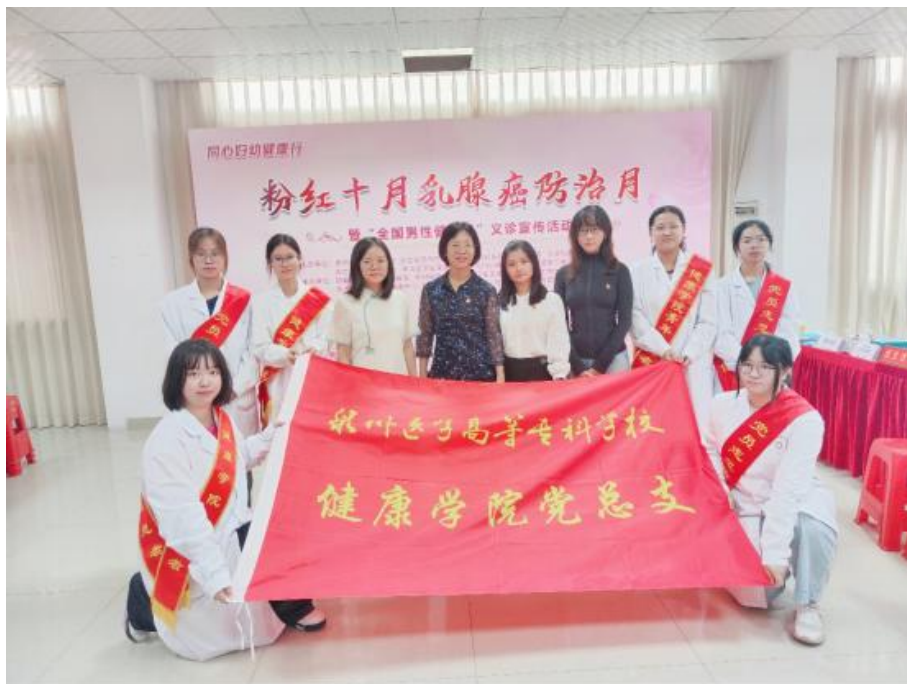
图 7-3 学校组织党员、入党积极分子开展志愿服务

组织申报省级高校“双带头人”教师党支部书记“强国行”专项行动，不断强化高校“双带头人”队伍建设和作用发挥。护理学院教工党支部、药学院教工党支部、健康学院教工党支部获评省级“双带头人”教师党支部书记“强国行”专项行动团队（图 7-3）。持续深化“党旗在一线高高飘扬”活动，组建泉州医高专“海丝先锋”党员突击队，吸收政治素质好、组织纪律性强、具有奉献精神的党员干部参加，更好服务学校等中心工作和应对紧急突发事件。