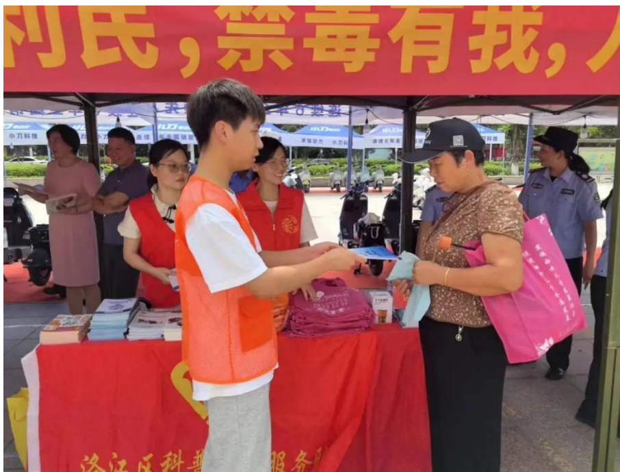
图 2-6 “青春医者筑防线，禁毒防艾显担当” 等社会实践活动