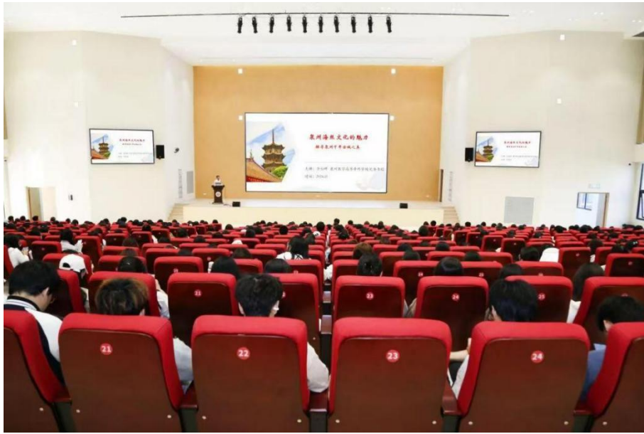
图 4-5 开设《泉州海丝文化的魅力》课程

在课堂教学中融入文化传承，教师利用专业技术支撑，开展有教育特色、专业特色、有内涵、有创新、有文化传承的课程思政，采用互联网+教学平台，创新性整合教学和行业资源，将思政元素、中华优秀传统文化以微课、视频等素材形式引入课程教学。