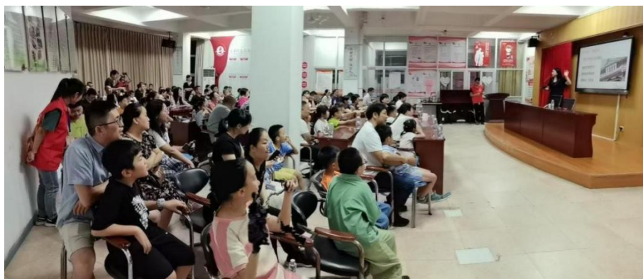
图 3-10 英语教研室老师公益讲座现场