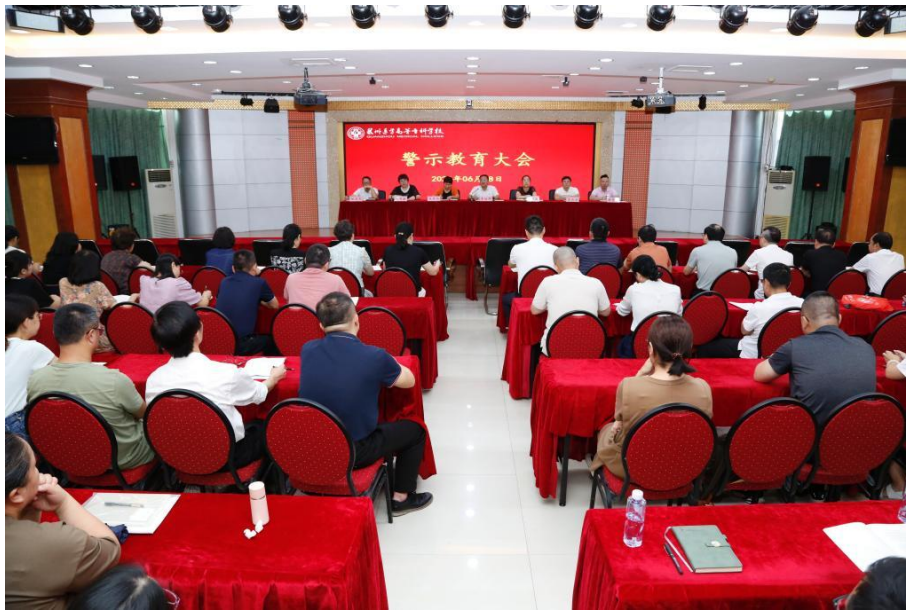
图 7-1 学校召开党纪学习教育警示教育大会