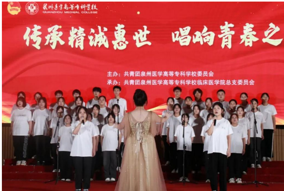
图 2-4 “传承精诚惠世，唱响青春之歌”校园合唱比赛

晚会，营造浓厚的艺术氛围。各学生社团开展“品文悟韵，墨映芳华”书籍感悟演讲比赛、“青春华彩，翰墨庆国”硬笔书法比赛、“轮上飞舞，板间青春”摄影比赛等，强化学生社团建设。组织了“向海图强 奋辑逐浪”“与星同行，点亮未来”“探寻海丝之路，叙述海丝港市故事”“青春医者筑防线，禁毒防艾显担当”等社会实践活动（见图 2-6），鼓励广大青年学子在社会大课堂“受教育、长才干、作贡献”，社会实践获得多家媒体报道。这些活动丰富了同学们的课余生活，多方位助力学生德智体美劳全面发展。