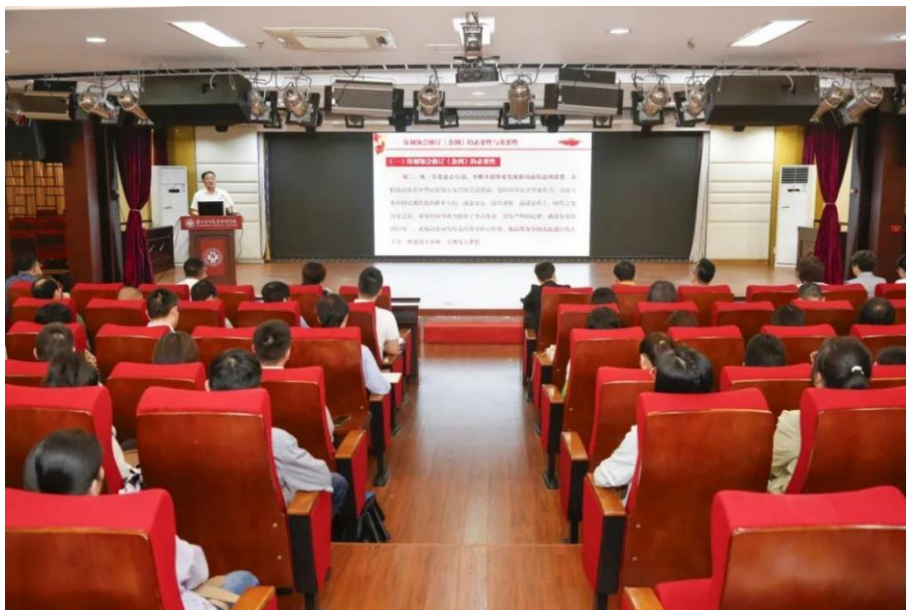
图 7-2 李伯群书记上党纪学习教育专题党课