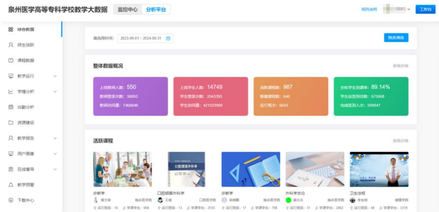
图 2-7 学校教学大数据分析平台

学校积极搭建云课堂教学平台、超星学习通平台，开展线上教学，同时积累教学全过程产生的数据，进行教学过程分析，为教学管理评估提供数据支撑，更好地帮助教师适时调整教学手段与教学内容。2023-2024 学年持续拓展线上教学平台使用覆盖面，550 名教师（含兼职教师）利用学校网络教学平台辅助开课和线上教学，全校活跃课程门数 980 门、学习学生 2043393 人次。