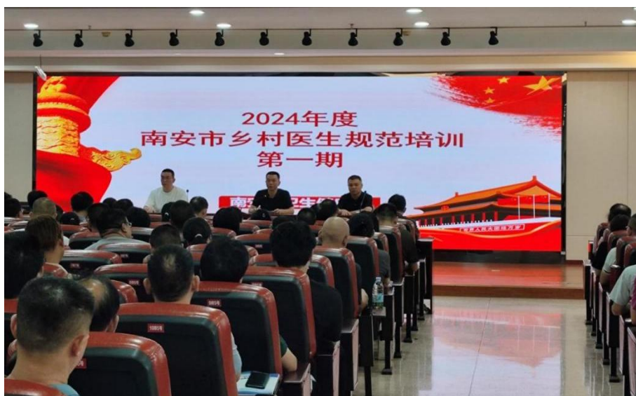
图 3-12 2024 年南安培训点乡村医生规范培训开班仪式