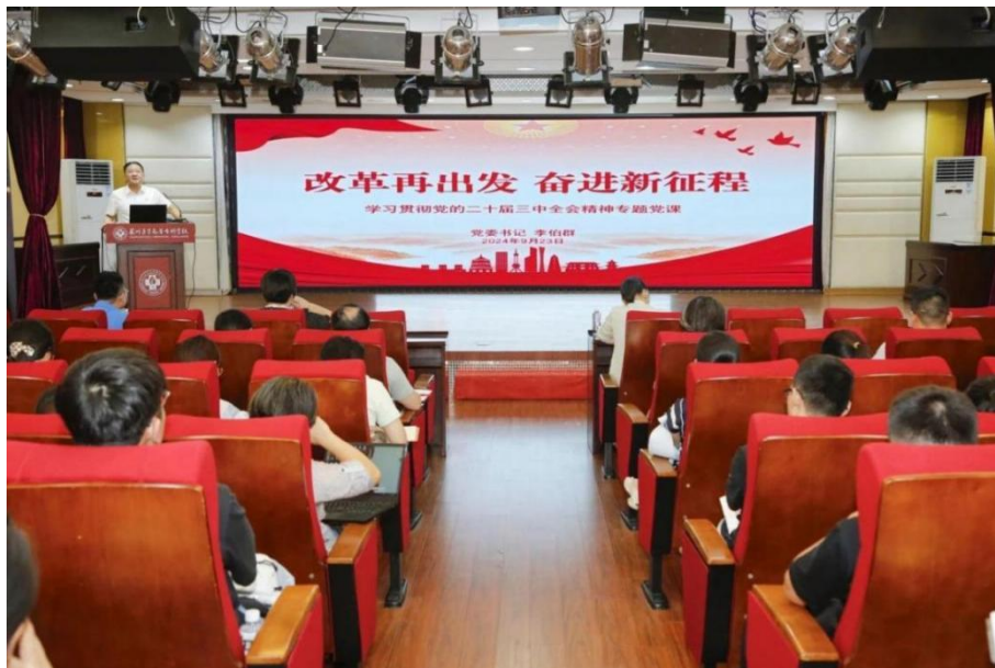
图 2-1 李伯群书记宣讲党的二十届三中全会精神

要任务,深入学习贯彻习近平总书记重要讲话和重要指示批示精神、党的二十届三中全会精神、习近平总书记关于教育的重要论述等(见图 2-1),赴谷文昌干部学院开展“学习贯彻党的二十届三中全会精神”主题党日活动。党纪学习教育以来,共组织开展党委理论学习中心组专题学习 7 次,读书班 1 期,专题研讨 1 次,现场教学 1 场,专题辅导讲座 2 场,一体推进原原本本学条例、警示教育、解读培训,推动党纪学习教育有序开展。组织思政教师参加学习贯彻党的二十届三中全会精神集中培训,通过“三会一课”、主题党日、主题宣讲、主题党课等引导党员、师生学在日常、学在经常,推动理论学习教育有效覆盖。