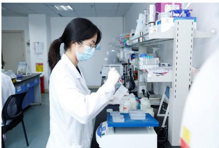
图 3-4 泉州市医学研究中心入驻人员开展科研工作