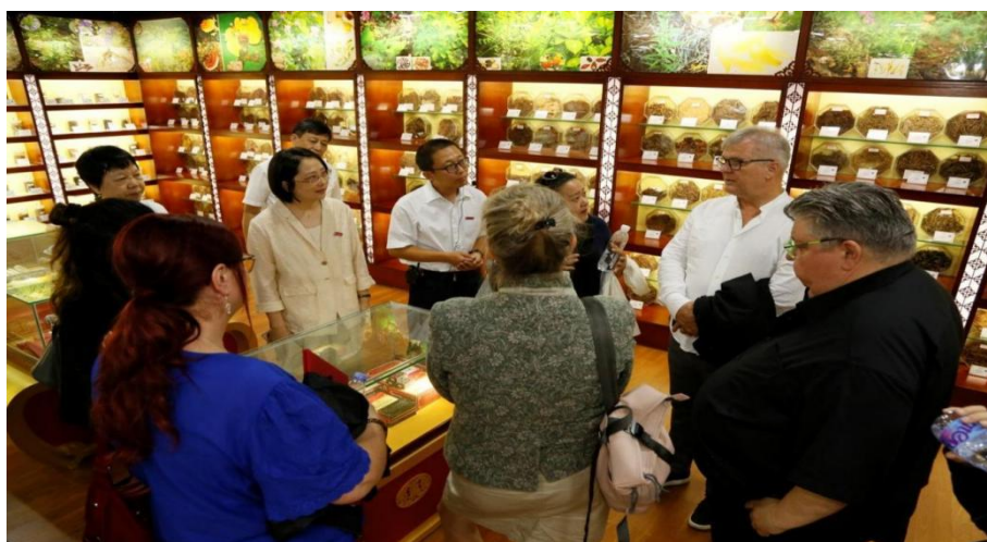
图 3-17 中德医养康护工作人员参访中药标本馆