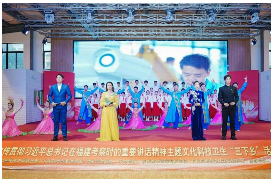
图 2-3 泉州市学习宣传贯彻习近平总书记在福建考察时的重要讲话精神主题文化科技卫生“三下乡”（泉州医高专专场）活动