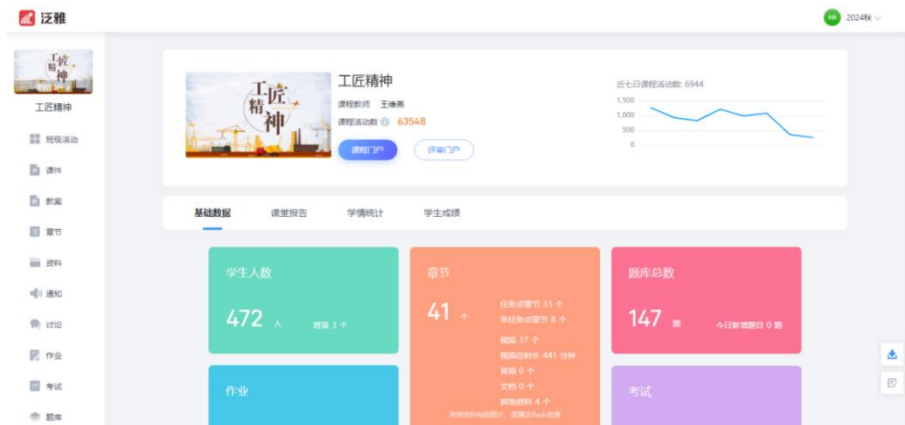
图 4-1 《工匠精神》课程数据

进一步探索和构建“工匠锻才”育人模式，讲好“工匠锻才”故事，努力培育德技双修的高素质技术技能医药卫生人才。开设《工匠精神》课程（见图 4-1），引导学生立志成为一名对国家、对社会有所贡献的优秀工匠、杰出工匠，乃至“大国工匠”。同时培养学生自主认知、正确感悟工匠精神的能力，使之具有理解、践行、弘扬工匠精神的积极情感和自觉意识，进而为全面提升职业素质奠定坚实的思想基础。