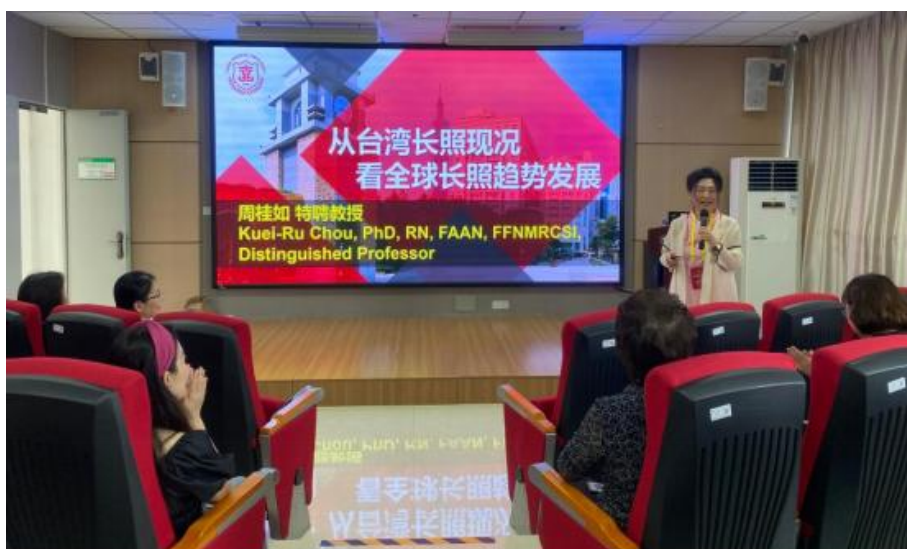
图 3-18 开展两岸交流活动

聚焦闽台社区日间照护服务标准化建设,牵头制定两岸养老护理服务共通标准 3 项,经两岸行业专家联合审定后实施。通过构建科学规范的场所设施、服务流程及人员培训标准体系,推动泉州市及福建省日间照护服务规范化发展,为两岸养老护理服务提供可复制的实践范式。2024 年开展两岸交流活动 1 场,邀请台北医学大学特聘教授周桂如与学校、泉州市养老机构开展两岸养老护理服务发展研讨会(见图 3-1)。以标准为依据,向泉州市政协提交决策咨询报告 1 份。