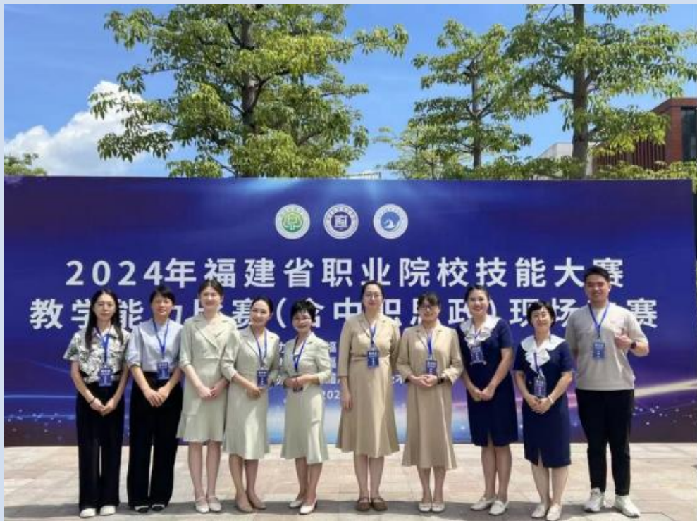
图 2-11 2024 年福建省职业院校技能大赛教学能力比赛