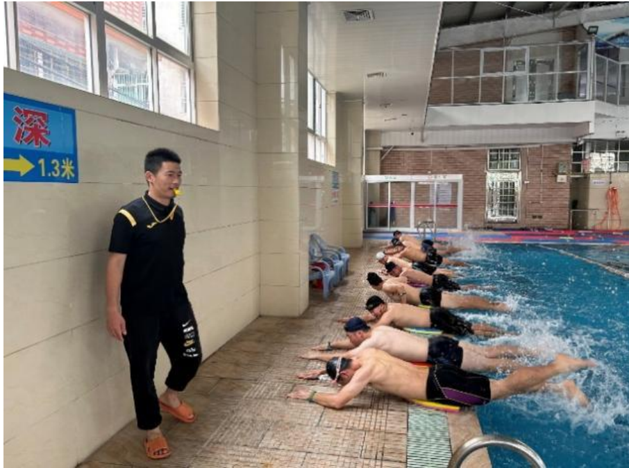
图 3-11 体育教研室老师指导消防员训练