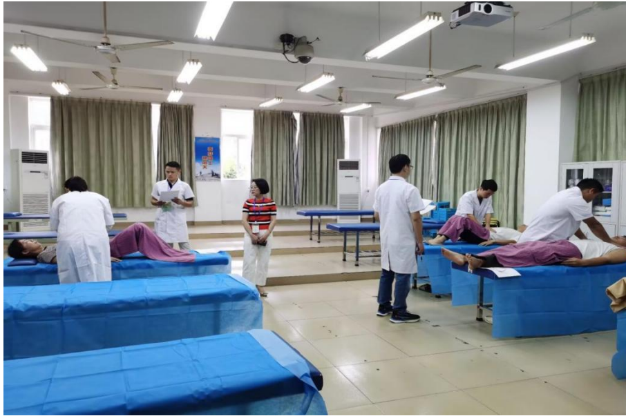
图 3-2 技能人才评价（保健推拿）现场考核