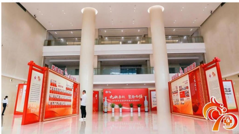
图 4-8 泉州医学高等专科学校高质量发展成果展

州市档案馆、泉州师范学院档案馆查阅学校档案、历史资料，梳理、丰富和完善校史资料，牵头各部门、学院深入挖掘学校的历史沿革、办学理念、办学成果以及九十年来所获市级以上集体表彰等，展示和宣传学校的发展历程、办学成果和人文精神（见图 4-8）。以“峥嵘岁月九十载，携手共筑新篇章”第十八届校园文化艺术节为载体，推出“精诚九秩育桃李 惠世华章谱新篇”文艺汇演等系列活动，全面活跃校园文化生活，持续推动惠世医学人文培育体系建设。将校史文化融入课程设置中，开设校史课程，定期举办校史宣讲、校歌传唱、校史知识竞答等活动，为党校第 41 期党员发展对象培训班讲授《校史与校情》、举办“春华秋实九十载 精诚惠世争一流”校史校情专题讲座（见图 4-9）、开展“学习党史校史，传承精神谱系”知识竞赛、组织学生和新入职教师参观校史馆，做到全员覆盖，充实和发挥校史馆育人功能，让学校历史和办学精神深入人心，厚植全体师生爱校情怀。