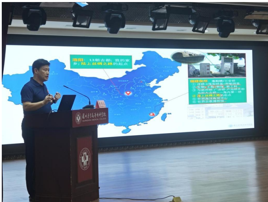
图 2-9 董为人教授来校做讲座

方法)等灵活先进的教学方法,进行启发式讲授、互动式交流、探究式讨论,做到教学相长。开展课堂革命典型案例遴选,凝练总结推广个人或团队在落实立德树人根本任务、推进“三教改革”、提高课堂质量、创新教学方法手段、改革考核方式等方面具有创新性、突破性、典型性的经验和做法。2023-2024 学年共遴选课堂革命案例 27 项。