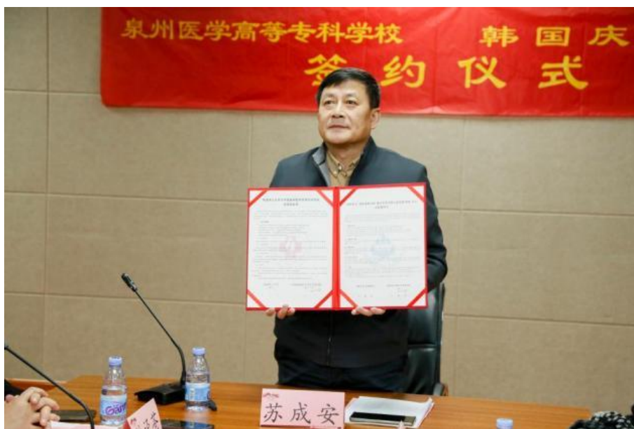
图 5-2 学校和韩国庆云大学举行线上合作交流暨签约仪式（学校）