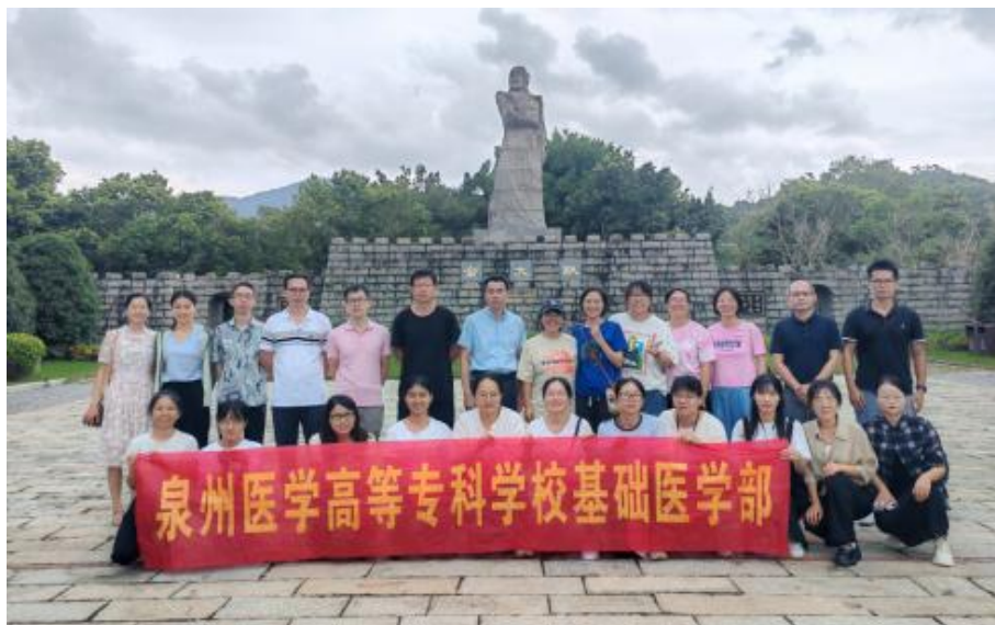
图 4-2 基础医学部组织教师走进俞大猷纪念馆