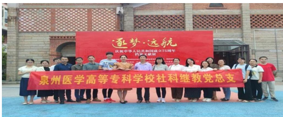
图 4-3 社科继教党总支参观“逐梦·远航”——庆祝中华人民共和国成立 75 周年档案文献展