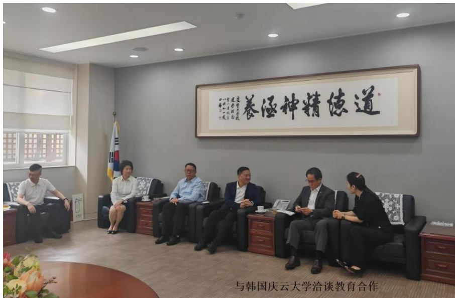
与韩国庆云大学洽谈教育合作