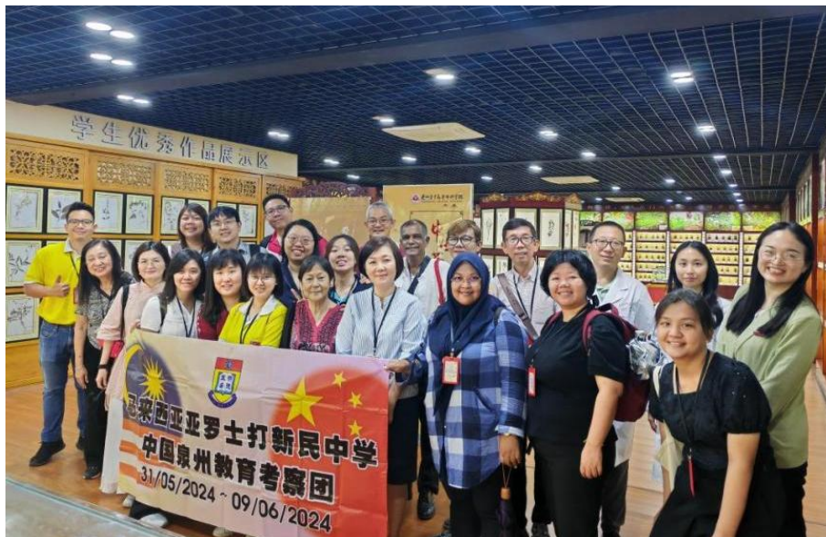
图 5-5 马来西亚新民独立中学代表团来校开展交流活动

在职业教育国际交流的浪潮中,学校以创新实践书写"职教出海"新篇章。承办马来西亚亚罗士打新民独立中学中国寻根之旅冬令营中“环保手工皂制作”项目(见图 5-5),提升其环境保护意识,各类培训合计 3000 余人次。未来,学校将继续深化国际合作,拓展职教新领域,为构建人类命运共同体贡献职教力量。