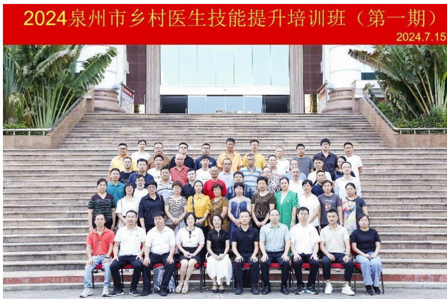
图 3-13 2024 年泉州市乡村医生技能提升培训班合影