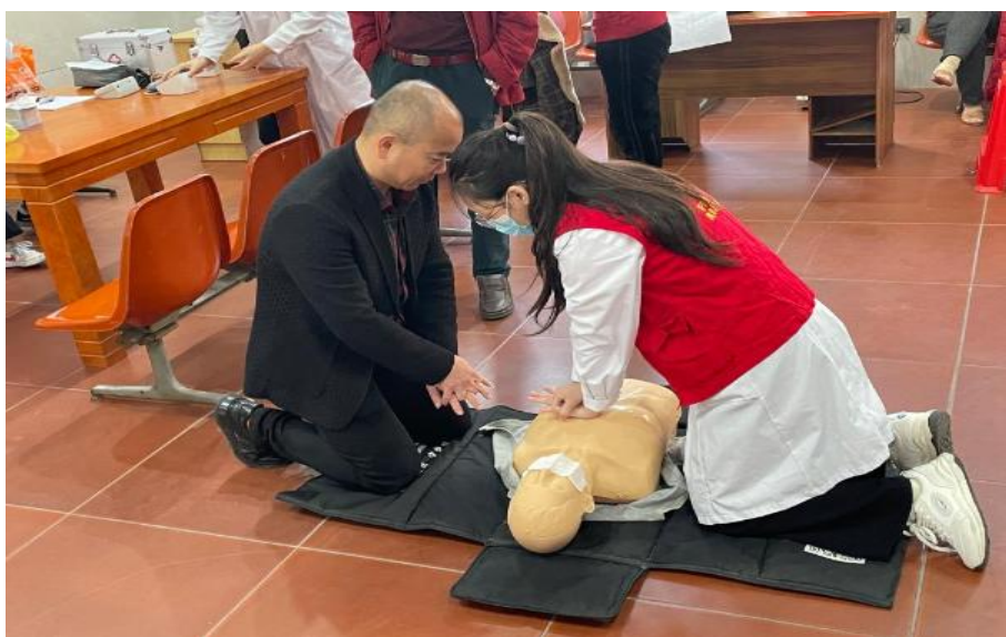
图 3-14 为社区居民进行急救技能培训演示心肺复苏

学校积极参与数字化课程资源建设和终身教育理论研究,《营养与膳食》课程入选 2024 年福建省终身教育促进委员会组织的省级继续教育数字化精品课程社区(老年)教育课程、《“全生命周期口腔预防保健”社区教育课程的构建与实践》课题入选 2024 年福建省终身教育提质培优项目。《临床护理科研新进展培训班》《海峡两岸老年健康研究新进展培训班》2 个项目获批市级继续医学教育培训项目。