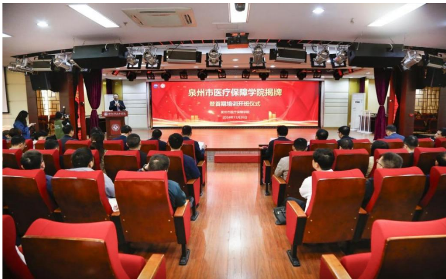
图 3-7 泉州市医疗保障学院揭牌暨首期培训开班仪式

学校坚持立足泉州，面向福建，整合多方资源，打造各级各类职业培训中心（基地），本学年，获批福建省专项职业能力统一考核考点、福建省退役军人技能培训机构，与泉州市医疗保障局共建泉州市医疗保障学院（见图 3-7）。依托各中心（基地）广泛开展职业培训，与教育、卫健、医疗保障等行政部门对接，培育了医疗保障从业人员培训、乡村医生培训、医疗护理员等特色培训项目，有效提升区域基层卫生人才队伍技能水平和业务能力，服务地方医疗卫生事业高质量发展（见图 3-8）。