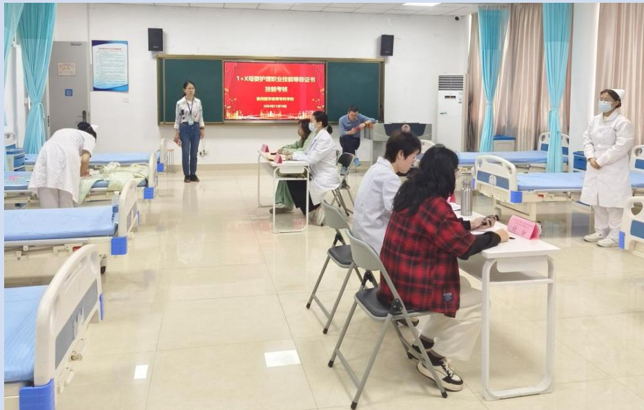
图 2-12 学生进行 1+X 考核

根据行业标准、护理岗位能力及学生发展需求，构建以岗位胜任力为导向的“平台+方向”课程体系。将“1+X”课程等纳入人才培养方案，推进“1”和“X”的有机衔接。