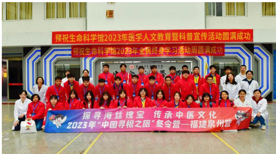
图 3-16 马来西亚华文中学冬令营参访生命科学馆

学校依托国家级医师资格考试基地面向社会考生开展执业医师考试服务，近三年累计服务 6523 人次。学校开放生命科学馆、中药标本馆接待国内外嘉宾、省市行政部门领导、医学院校同行、高校、中小學生等参观和考察，近两年累计接待 2400 余人次（见图 3-16 和图 3-17）。除了接待参访人员，学校还根据《教育部办公厅关于广泛开展全民终身学习活动的通知》等文件精神组织策划了“9.28 终身教育活动周”“医学人文教育暨科普宣传活动”“科普进校园”“科普进社区”等系列活动，深受社会好评，场馆获评第八批泉州市科普教育基地、泉州市我最喜爱的十佳科普教育基地、洛江区科普教育基地。活动获多家媒体报道，受到服务对象好评和青睐，产生了良好的社会效益。