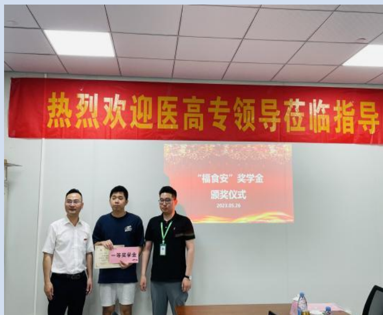
图 6-1 企业为学生设立“福食安”奖学金

“食品安全检验产业学院”以“335”人才培养模式，召开专业教学指导委员会；校企共同辅导学生参加省技能大赛，获二等奖 2 项，三等奖 1 项；开展职业技能等级认定和 1+X 职业技能证书考核，通过率 87.5%；企业设立“福食安”奖学金，获奖学生 30 人次；投入 170 万元新增数字化实训室 1 间，搭建食品安全检验数字化云平台；教师深入企业实践 16 人次、参加企业培训 35 场次，“双师”比例 87.5%；主持全国高职卫检专业教学标准修订；获国家级教学成果二等奖 1 项，省级教学能力赛三等奖 1 项，市级以上课题 3 项，发表论文 8 篇，出版教材 5 部。推动合作企业获福建省食品工业协会、福建省高新技术企业等荣誉。