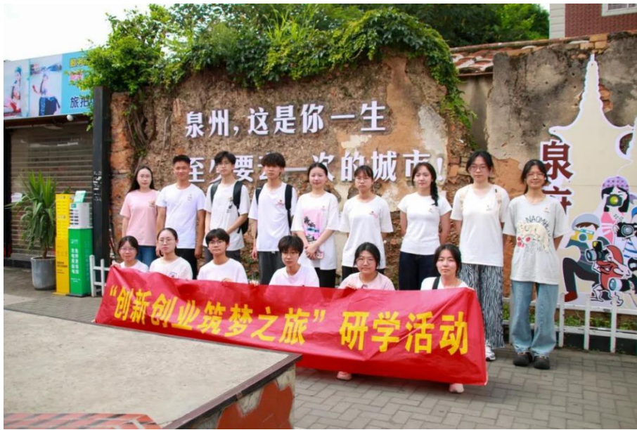
图 4-6 “创新创业筑梦之旅” 研学活动