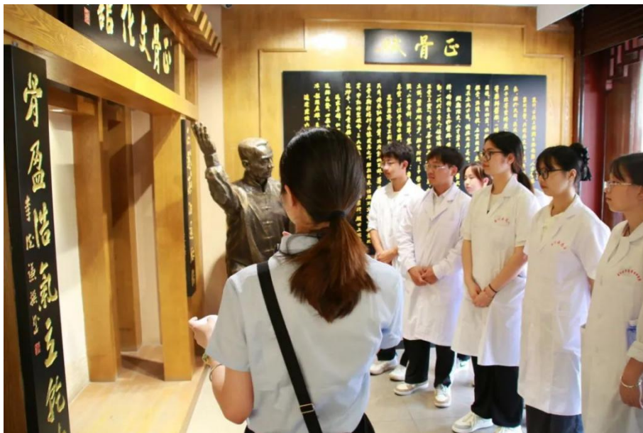
图 4-7 “探寻闽南中医药文化宝藏，感受世遗文化魅力” 研学活动