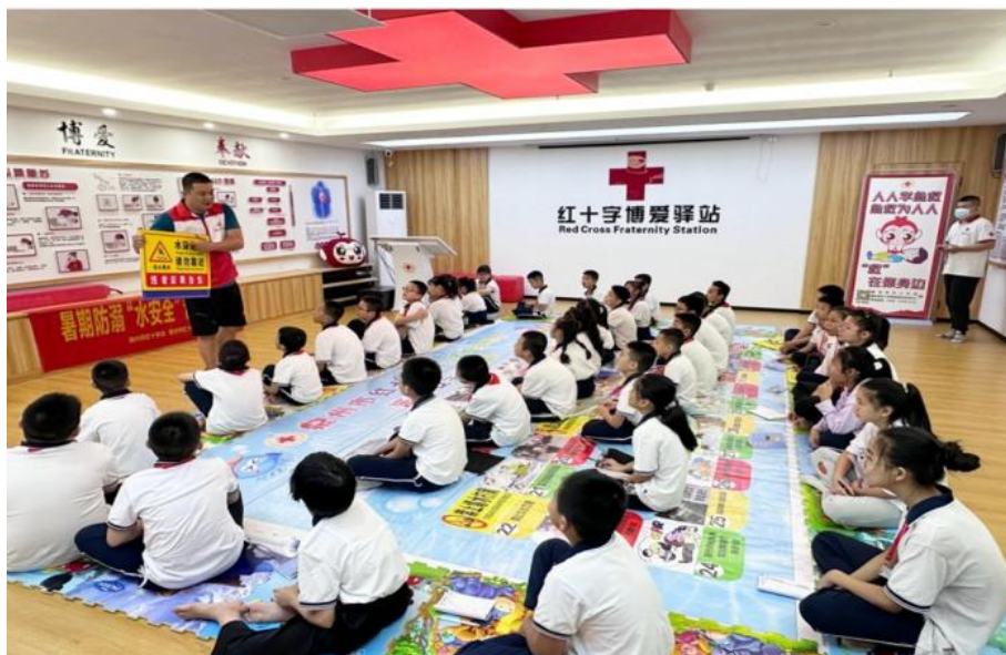
图 3-9 体育教研室老师带来暑期防溺水安全知识普及课

论知识与实践经验相结合,评估并提升了企业的用电安全和节能管理水平,为社会节约能源和提升安全性能做出了贡献。通过这些活动,学校教师不仅将专业知识服务于社会,也展现了学校教师的社会责任感和专业能力。